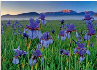
Bernd Römmelt – Natur vor der Haustür