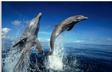
Konrad Wothe – Ein Leben für die Tierfotografie