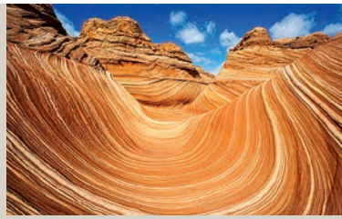
Norbert Rosing – USA – The West